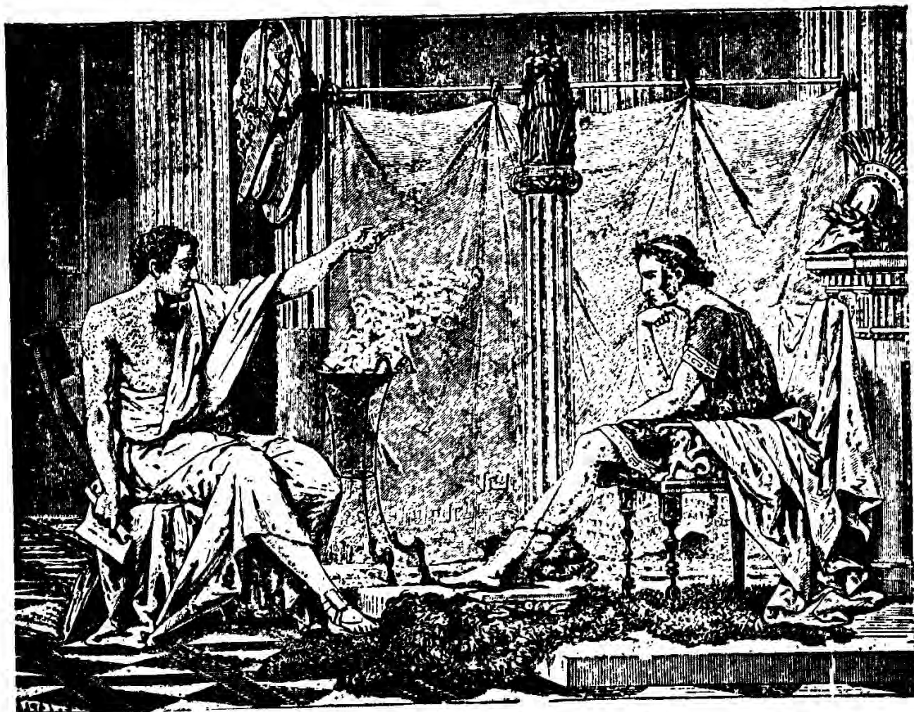
Ὁ Ἀριστοτέλης διδάσκων τὸν Ἀλέξανδρον