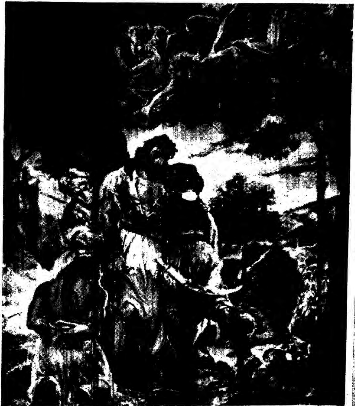
Ο Ίμπραήμ αποπάζεται τὸν νεκρὸν τοῦ Παπαφλέσσα.

ΤΡΙΜΗΝΙΑ ΕΠΙΣΤΗΜΟΝΙΚΗ ΕΚΔΟΣΙΣ ΔΙΔΑΣΚΑΛΙΚΗΣ ΟΜΟΣΠΟΝΔΙΑΣ ΕΛΛΑΔΟΣ